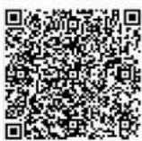
Persembahan - Kartong 1 Pengeluaran Rutin Gereja