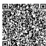
Persembahan - Kartong 2 Minggu 2: STTRII