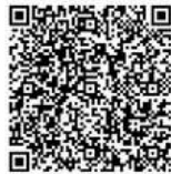
Persembahan - Perpuhan

SEKRETARIAT - Telp. (021) 537 5232; WA. 0821 4400 5080 Website: www.grii-gadingserpong.org